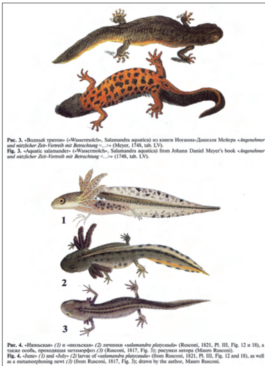
Рис. 3. «Водный тритон» («Wassermolch», Salamandra aquatica ) из книги Иоганна-Даниэля Мейера «Angenehmer und nützlicher Zeit-Vertreib mit Betrachtung...» (Meyer, 1748, tab. LV). Fig. 3. «Aquatic salamander» («Wassermolch», Salamandra aquatica ) from Johann Daniel Meyer's book «Angenehmer und nützlicher Zeit-Vertreib mit Betrachtung...» (1748, tab. LV).